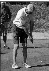
Golfista sul green di Capriva

sviluppo del territorio. Così 18 produttori vinicoli hanno deciso di adottare le 18 buche del campo di golf. Ogni giocatore potrà così conoscere i vini di queste aziende che vanno da Dolegna a San Floriano, da Cormons a Savogna. In più 22 operatori turistici, titolari di bed&breakfast, ristoranti, agriturismo, alberghi e trattorie, hanno deciso di sposare questa iniziativa nella speranza di ottenere un ritorno